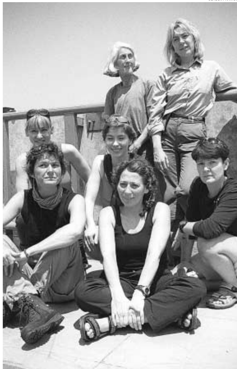
ESTAS MUJERES integran el equipo que ascenderá al monte Aconcagua, el más alto de Sudamérica, para demostrar que no son minusválidas y que todo se puede superar.